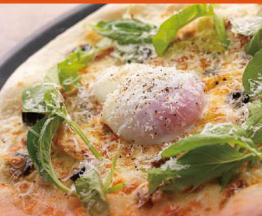
龍のたまごと自家製ベーコンのビスマルク ¥2,000 Bismarck Pizza made with Ryu no Tamago Egg