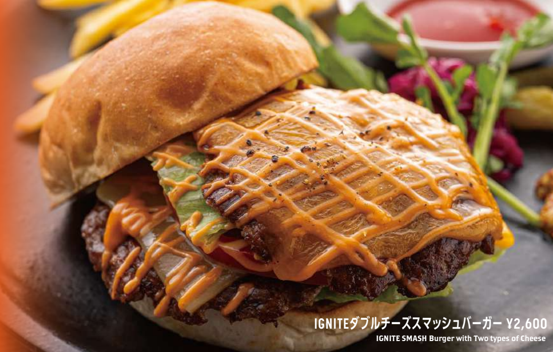
IGNITEダブルチーズスマッシュバーガー ¥2,600 IGNITE SMASH Burger with Two types of Cheese

アメリカ発祥のハンバーガーの調理法で、パティを鉄板に押し付けて焼くことで、外はカリカリ、中はジューシーに仕上げるのが特徴です。この調理法により、香ばしさと肉の旨みが一層引き立ち、スマッシュでしか味わえない唯一無二のハンバーガーに仕上がります。