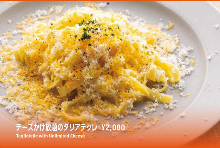
チーズかけ放題のタリアテッレ ¥2,000 Tagliatelle with Unlimited Cheese