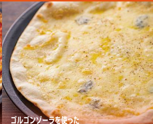
ゴルゴンゾーラを使った クワトロフォルマッジョ ¥1,900 Quattro Formaggi with Gorgonzola