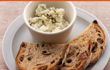
ブルーチーズのムース ¥600