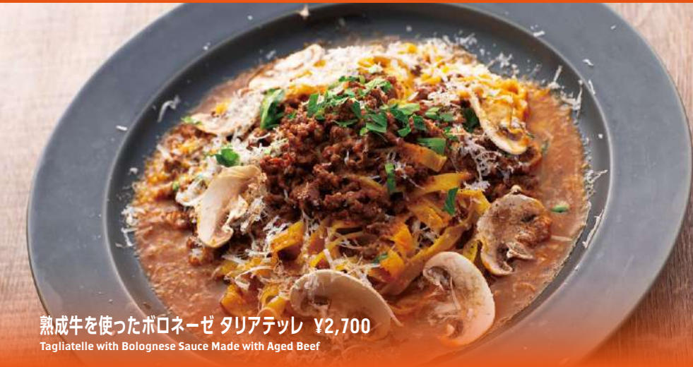
熟成牛を使ったボロネーゼ タリアテッレ ¥2,700 Tagliatelle with Bolognese Sauce Made with Aged Beef