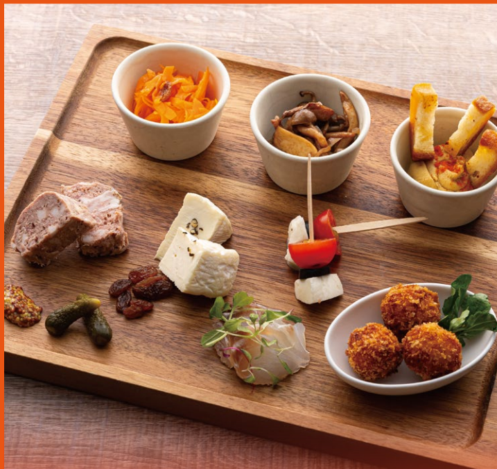
タパス盛り合わせ 1~2人前 ¥1,700 / 2~3人前 ¥2,500 Assorted Tapas / for 1-2 person / for 2-3 person

表示価格は全て税金・サービス料込みの 価格となっております All prices include tax and service charge