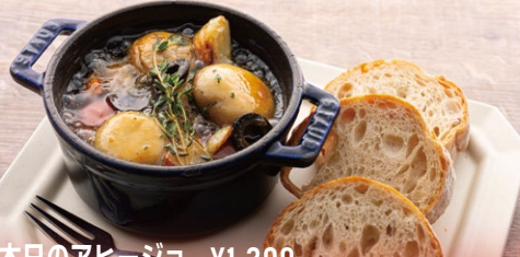
本日のアヒージョ ¥1,300

Seasonal Fruits and Various Types of Tomatoes Caprese