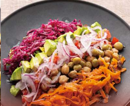
サラダレギューム ¥1,200 Vegetable Salad