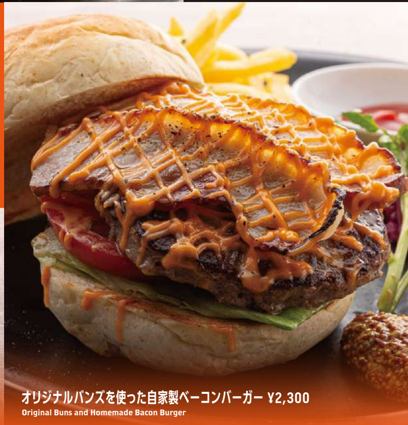
オリジナルパンズを使った自家製ベーコンバーガー ¥2,300 Original Buns and Homemade Bacon Burger