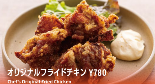
オリジナルフライドチキン ¥780