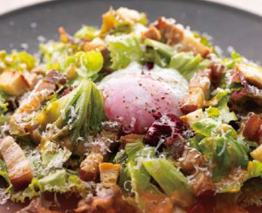
龍のたまごと自家製ベーコンのシーザーサラダ ¥1,000 Ryu no Tamago Egg and Homemade Bacon Caesar Salad