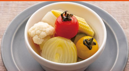
はちみつレモン仕立ての自家製ピクルス ¥580