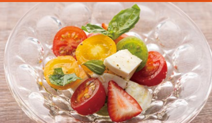
季節のフルーツを使ったカプレーゼ ¥1,200

Seasonal Fruits and Various Types of Tomatoes Caprese