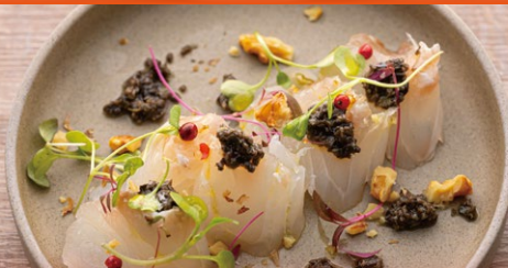
本日のカルパッチョ ¥850