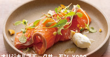
オリジナルスモークサーモン ¥800