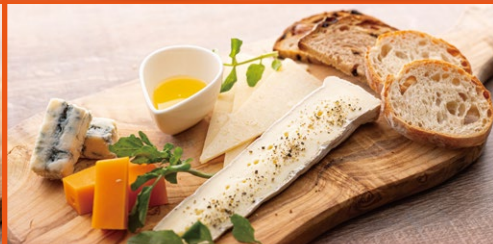
4種チーズ盛り合わせ ¥1,200