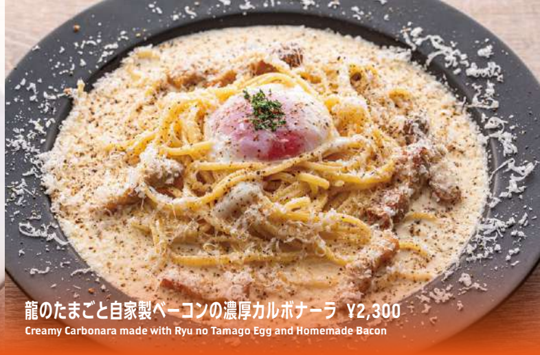
龍のたまごと自家製ベーコンの濃厚カルボナーラ ¥2,300 Creamy Carbonara made with Ryu no Tamago Egg and Homemade Bacon