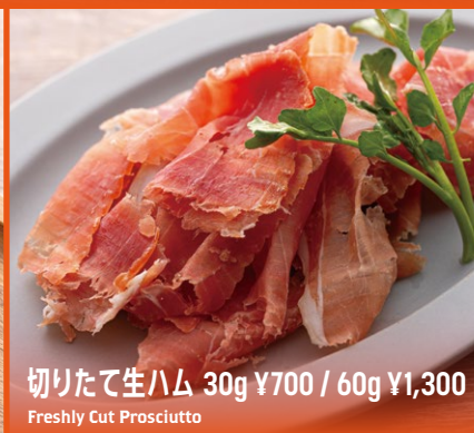
切りたて生ハム 30g ¥700 / 60g ¥1,300 Freshly Cut Prosciutto

プレーン 80g ¥800 / ペッパー 80g ¥800 骨付きフランク 100g ¥1,100 / 3本盛り合わせ ¥2,200 Grilled Frankfurter / Plain 80g / Pepper 80g / Bone-in 100g / Assorted 3 Pieces