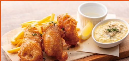
フィッシュ&チップス ¥1,200