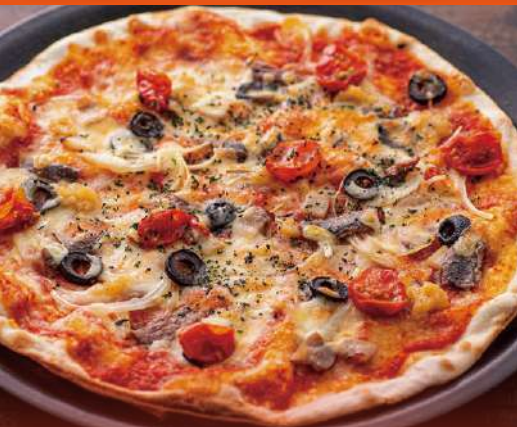
ピッツァ シチリアーナ ¥2,000 Pizza Siciliana