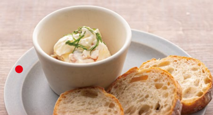
スモークサーモンのディップ ¥700