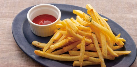
フレンチフライドポテト 100g ¥580