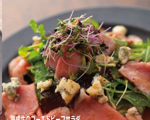
熟成牛のゴールドビーフサラダ バルサミコドレッシング ¥1,200 Aged Cold Beef Salad with Balsamic Dressing