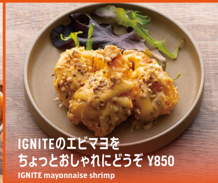
IGNITEのエビマヨを ちょっとおしゃれにどうぞ ¥850 IGNITE mayonnaise shrimp