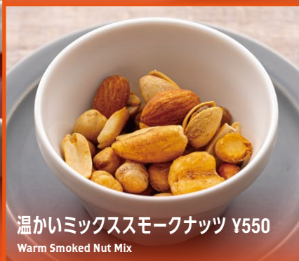
温かいミックススモークナッツ ¥550 Warm Smoked Nut Mix