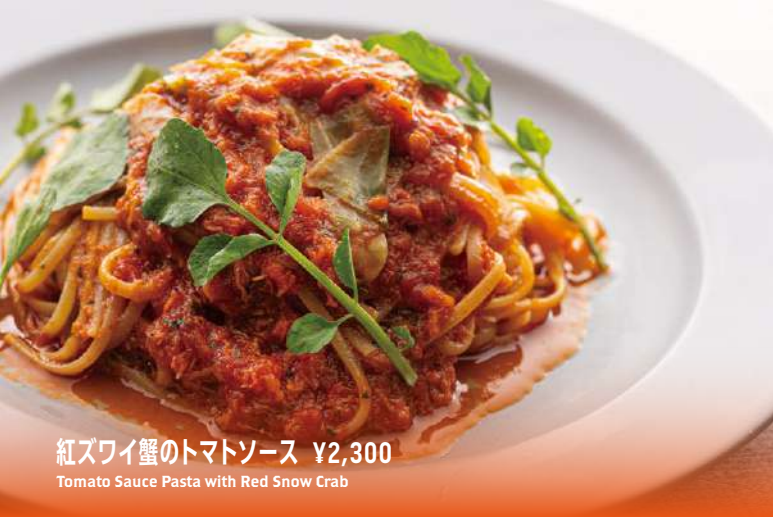
紅ズワイ蟹のトマトソース ¥2,300 Tomato Sauce Pasta with Red Snow Crab