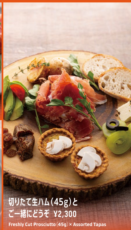
切りたて生ハム(45g)と ご一緒にどうぞ ¥2,300 Freshly Cut Prosciutto (45g) × Assorted Tapas