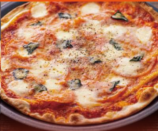
フレッシュトマトとモッツアレラのピッツァ ¥1,800 Fresh Tomato and Mozzarella