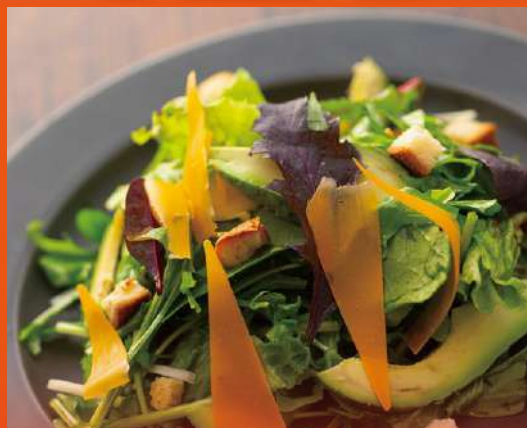
グリーンサラダ オニオンドレッシング ¥850 Green Salad with Onion Dressing

表示価格は全て税金・サービス料込みの価格となっております All prices include tax and service charge