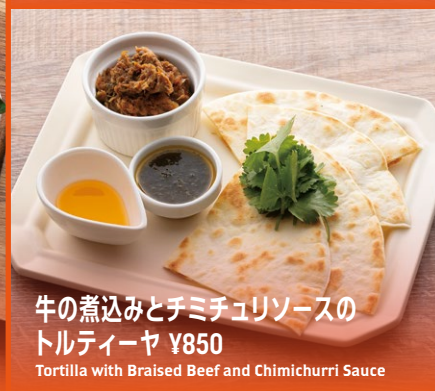
牛の煮込みとチミチュリソースの トルティーヤ ¥850 Tortilla with Braised Beef and Chimichurri Sauce