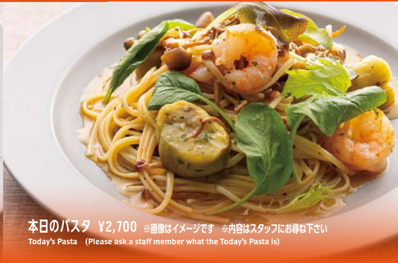
本日のパスタ ¥2,700 ※画像はイメージです ※内容はスタッフにお尋ね下さい Today's Pasta (Please ask a staff member what the Today's Pasta is)