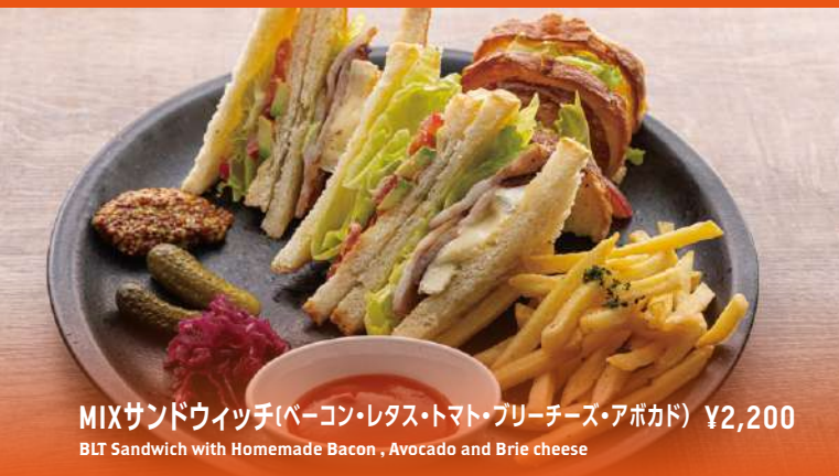
MIXサンドウィッチ(ベーコン・レタス・トマト・ブリーチーズ・アボカド) ¥2,200 BLT Sandwich with Homemade Bacon, Avocado and Brie cheese

表示価格は全て税金・サービス料込みの価格となっております / All prices include tax and service charge