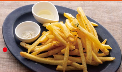
トリュフ風味のフレンチフライドポテト 100g ¥680