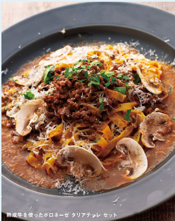
熟成牛を使ったボロネーゼ タリアテッレ セット