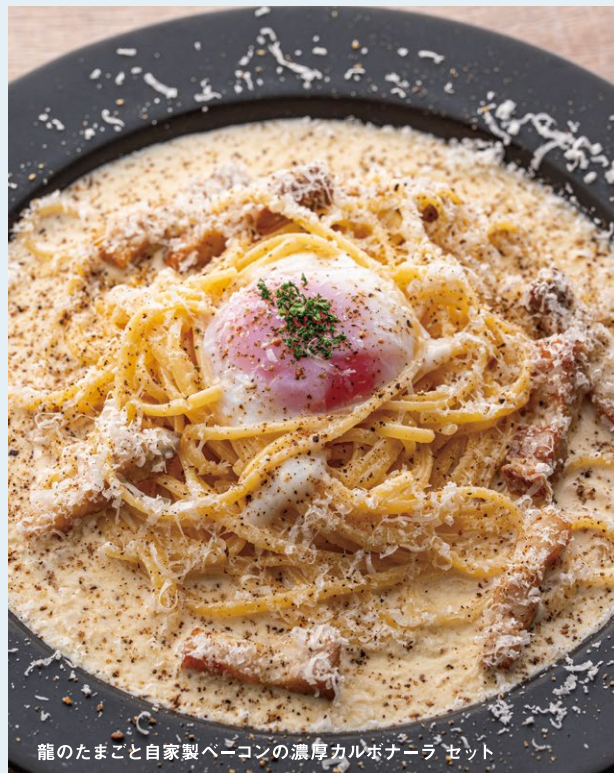
龍のたまごと自家製ベーコンの濃厚カルボナーラ セット